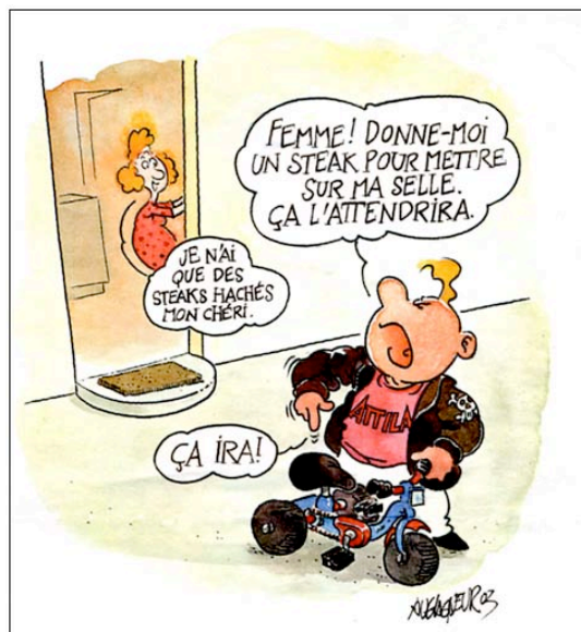
Fig. 1 : Les adultes projettent sur l'enfant les comportements de leurs propres parents envers eux, puis justifient de reproduire sur lui la violence et le mépris qu'ils ont subis. (Construire No 5, 28.1.03)

« troubles alimentaires, dépressions et tentatives de suicide, pathologies de la dépendances, délinquance par défi, ou encore angoisses, sentiments de vide intérieur, d'infériorité et d'inhibition... » (3) Un tel état d'esprit dispense les adultes de toute question qui remette en cause la base relationnelle sur laquelle ils fondent leur rapport à l'enfant et l'attitude de leurs propres parents envers eux (fig. 1).